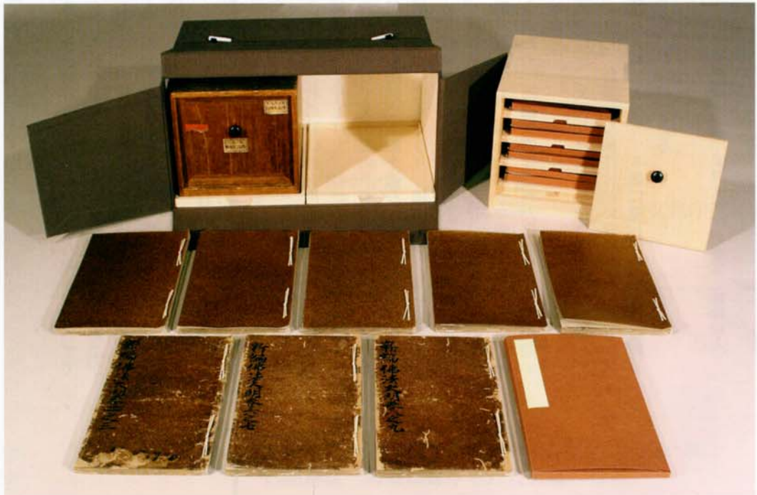
両面に書写された典籍の修理（重要文化財 新編仏法大明録 八冊〈財団法人松ヶ岡文庫所蔵〉）